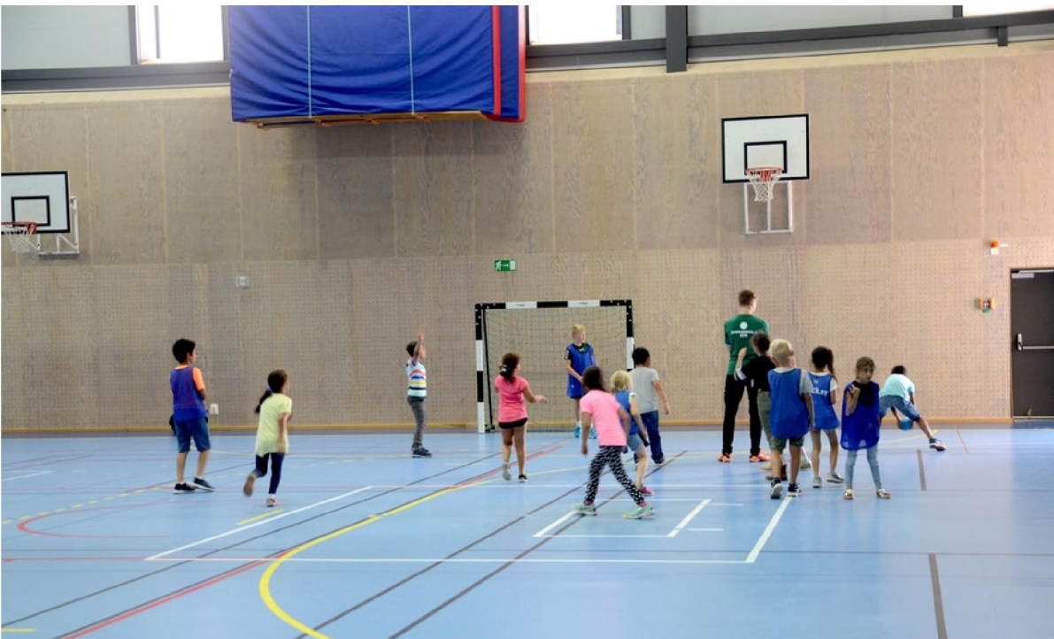
Barn från 18 olika skolor i staden deltog i OV:s sommarskola.

Under fredagen avslutades OV:s handbollssommarskola på Arenan. Under tre veckor har föreningen varit ute på skolorna runt om i staden och hållit i träningar för barn mellan 6 och 12 år. Den sista dagen lockade 400 deltagare och projektledaren Mats Jacobson berättar att intresset varit stort.